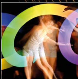
Foto-Workshop zum Thema Light Painting mit Pamela Battanta pamix.ch